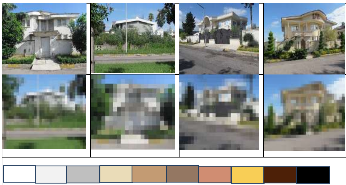
شکل (۳). لایه‌های رنگی کالبد مصنوع و بنا در شهرک چهارصد دستگاه