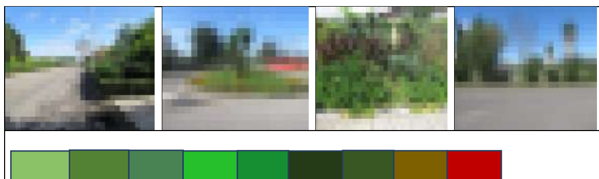
شکل (۴). لایه‌های رنگی پوشش گیاهی در شهرک چهارصد دستگاه منبع: نگارندگان