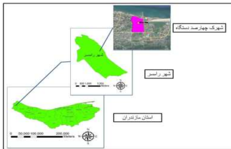
شکل (۱). موقعیت محدوده مورد مطالعه در تقسیمات کشوری