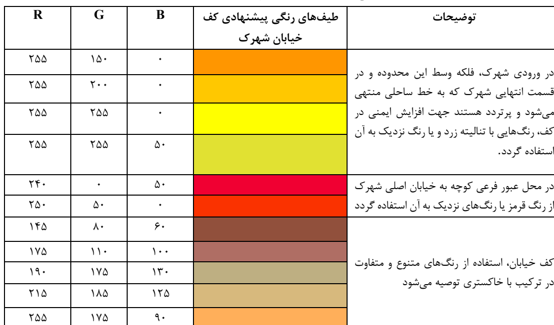
جدول (۹). طیف‌های رنگی پیشنهادی کف خیابان شهرک چهارصد دستگاه شهر رامسر